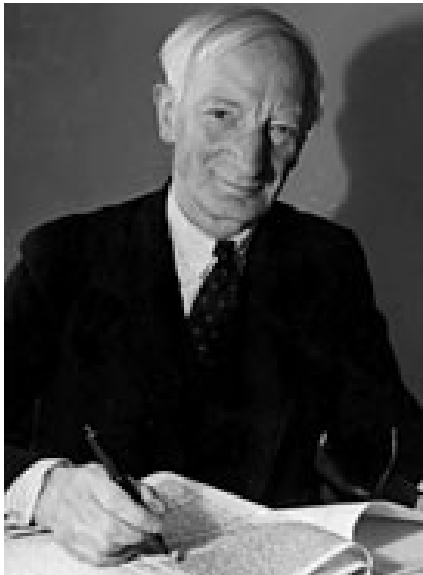
William Henry Beveridge , (1879-1963)