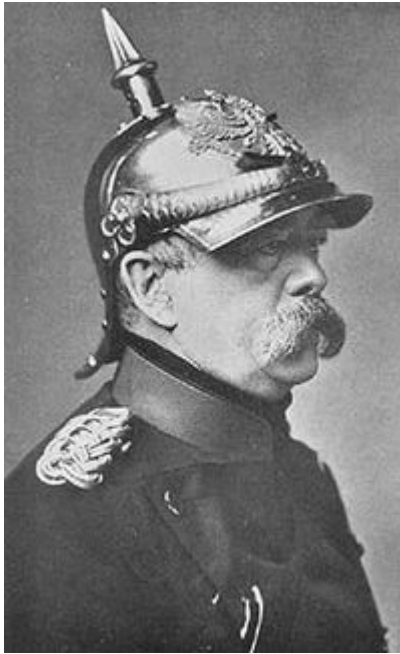
Fürst Otto von Bismarck (1815-1898)